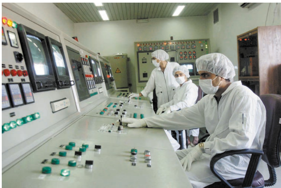
Техники Организации атомной энергии контролируют возобновление действий завода по переработке урана в диспетчерской предприятия

предлогом борьбы с терроризмом развертывают войска в регионе. Больше всего достается Ирану – ислам в Иране изображался грубой, агрессивной и страшной религией, на страну был навешен ярлык центра подготовки террористов. Скоро, правда, стало ясно, что на такую картину гораздо больше подходят соседние с Ираном страны – друзья США. Далее пошла разработка темы иранской военной угрозы для региона – мощь иранских вооружений, особенно ракет, предельно гипертрофировалась американской пропагандой с тем, чтобы, во-первых, запугать Ираном его соседей по Персидскому заливу, во-вторых, отвести внимание от политики Израиля и, в-третьих, под предлогом озабоченности иранскими ракетами начать раскрутку проекта развертывания в Европе американской системы ПРО, подлинная направленность которой, однако, оказалась понятной для всех. Так создавалась иранофобия.