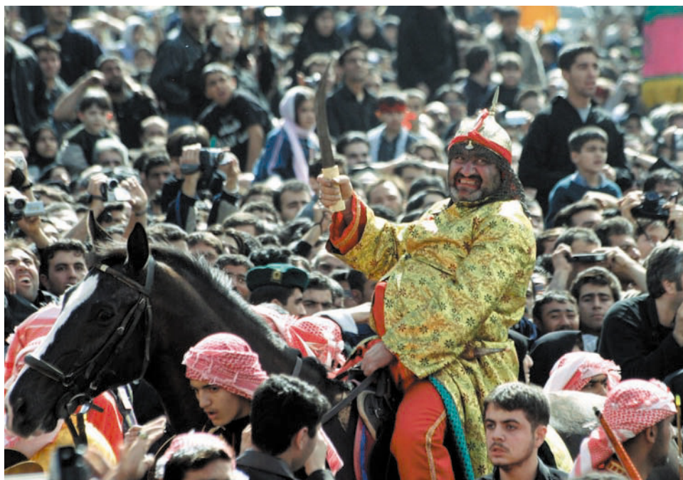
Жители Тегерана отмечают праздник Ашура - день поминовения имама Хусейна