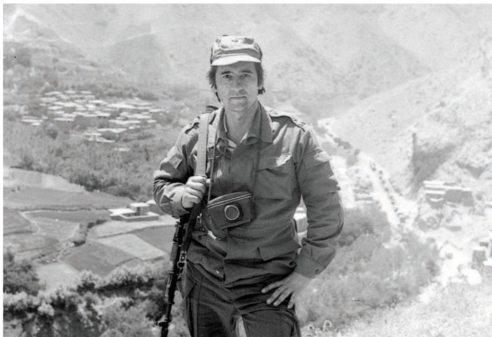
Александр Проханов не смотря на годы, не теряет боевой дух молодости

Ахмадинежад, знай, что в России есть много твоих приверженцев и сторонников. Одним из этих сторонников являюсь и я. Если американские крылатые ракеты и самолёты полетят на Тегеран и Бушер, вопьются в нефтяные поля, университеты, лаборатории и научные центры, знай, что я и многие мои собратья — мы твои воины. Своими книгами, стихами и молитвами, своим стрелковым и дальнобойным оружием, своей страстью и верой, мы будем рядом с тобой. Мы станем сбивать крылатые ракеты Америки, испепелять пропитанные ядом американские пасквилы. Я — твой воин, Ахмадинежад! ■