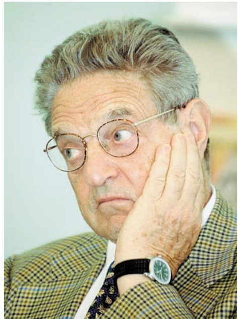
Американский бизнесмен-филантроп Джордж Сорос

Буквально на следующий день после президентских выборов 2009 г. в Иране мы указывали, что «Зеленое движение» не сможет свалить Исламскую республику по двум основным причинам: это движение далеко от того, чтобы представлять большинство иранского общества, и большинство иранцев продолжают поддерживать идею Исламской республики. Сегодня в дело вступили два дополнительных фактора, которые еще больше уменьшают возможность того, что те, кто в последнюю неделю организовал в Иране разрозненные демонстрации, сможет ускорить «смену режима» в стране.