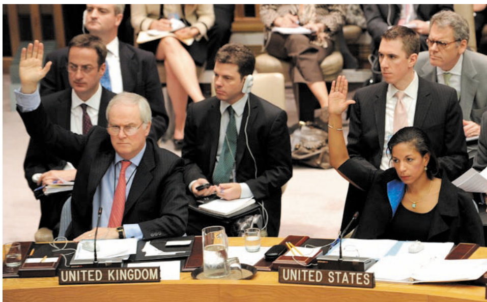
Постоянные представители в ООН: от Великобритании Марк Лайал-Грант и от США Сюзан Райс (слева направо) во время голосования на заседании Совета Безопасности ООН по вопросу ужесточения санкций в отношении Ирана.

литикой правительства настолько, что как известно, после президентских выборов 2009 года устроила акцию, которую можно отнести к политтехнологической категории «демонстрация гнева». Власти ответили жестко - на что и рассчитывали политтехнологи «зеленой революции». Силовая сшибка не могла не вызвать взрыва страстей, но власти - и гражданские, и духовные - развернули разъяснительную работу, эмоции улеглись, настроения в пользу стабильности и существующего порядка возобладали быстро. Войны внутри общества не получилось. Что бы ни говорили о «репрессиях режима», т.е. ответа силой на силу, суть дела очевидна: настроенных на войну с государством оказалось немного. Тот, кто был недоволен жизнью, но считал, что власть не настолько плоха, чтобы устраивать против нее беспорядки, ограничился подачей голосов против правительства и на улице не пошел. Большинство населения оппозицию не поддержало ни на выборах, ни после них.