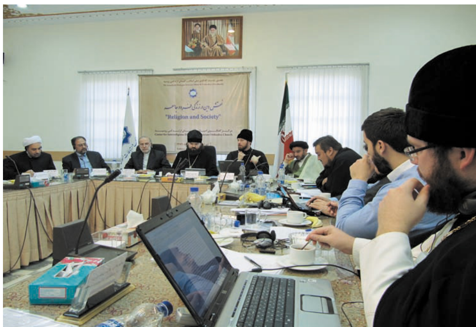
Участники заседания выступают с докладами

давления, угроз и нечестности, что разрушает межрелигиозный мир и попирает человеческую свободу. Обе стороны отвергли использование псевдомиссионерской деятельности для достижения политического, экономического и культурного господства.