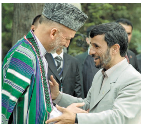
Президент Афганистана Хамид Карзай и президент Ирана Махмуд Ахмединежад (слева направо) перед началом встречи

При всей многовекторности внешней политики ИРИ одним из ее неизменных приоритетов остаются отношения с Афганистаном. Напомним, что в конце 70-х г.г. прошлого века в отношениях двух стран преимущественное значение приобрел, так сказать, чрезвычайный фактор, обусловленный сначала событиями апреля 1978 г. в Афганистане и вводом в страну советских войск, а затем внутривнутриполитической борьбой в этом государстве и нарастанием резкой напряженности в отношениях с режимом талибов. Ныне отношения между Тегераном и Кабулом во многом определяются фактом нахождения на афганской территории Международных сил содействия безопасно-