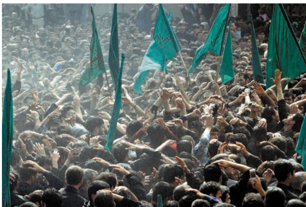
Ашура - день поминовения имама Хусейна

ботать в сфере международных отношений в качестве советника духовного лидера Исламской республики Иран аятоллы А. Хаменеи.