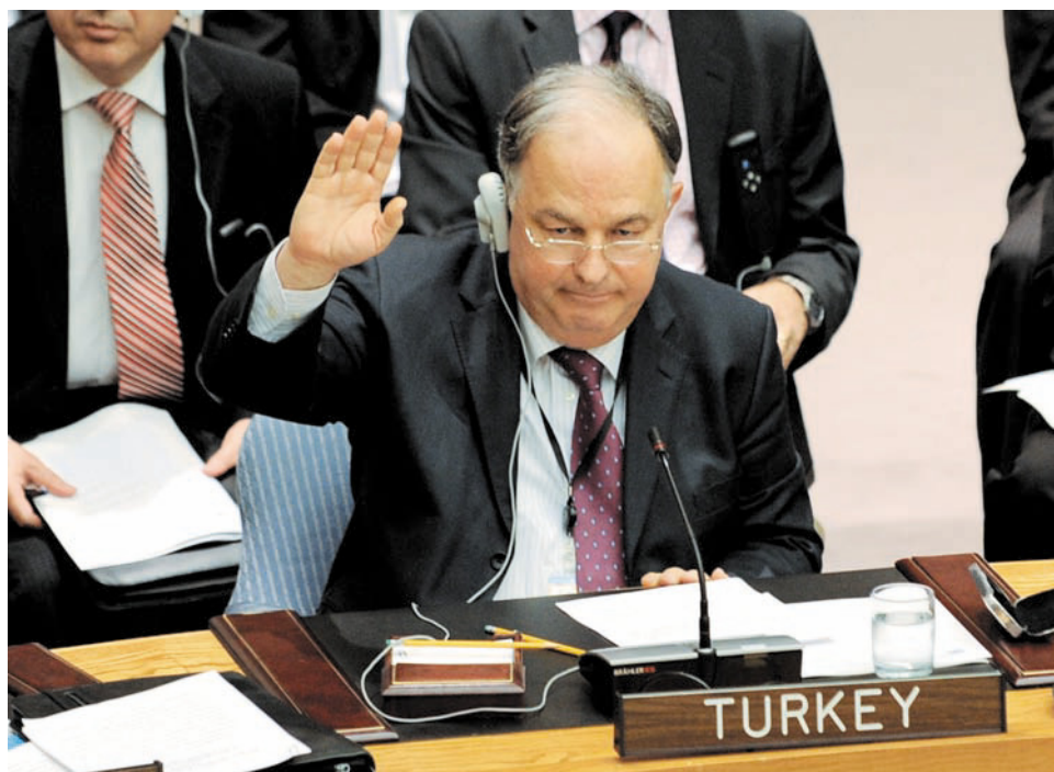
Постоянный представитель Турции при ООН Эртугрул Апакан во время заседания Совета Безопасности ООН по вопросу ужесточения санкций в отношении Ирана

ЕС вырос в 1,8 раза по сравнению с 1 полугодием 2009 г. и превысил 7 млрд. долл. (всего за 2009 г. иранский экспорт в ЕС по оценке МВФ составлял около 11 млрд. долл.), при этом в Великобританию он увеличился в 3 раза, Германию – почти в 2 раза. Экспорт в Китай, являющийся одним из крупнейших экспортеров Ирана (2009 г. – 12 млрд. долл.), увеличился на 30%, возросли и поставки в Россию, также на 25%.