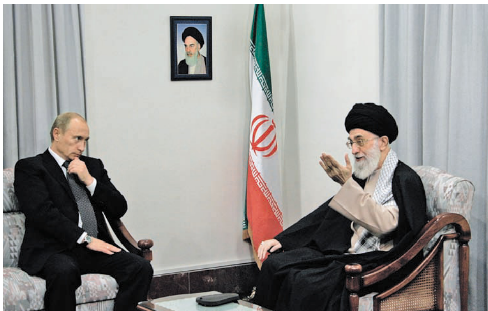
Владимир Путин и духовный лидер Ирана аятолла Сейед Али Хаменеи (слева направо) во время встречи в резиденции Хаменеи

зораспределительной сети страны, а также участвует в строительстве и обслуживании национальных газовых сетей.