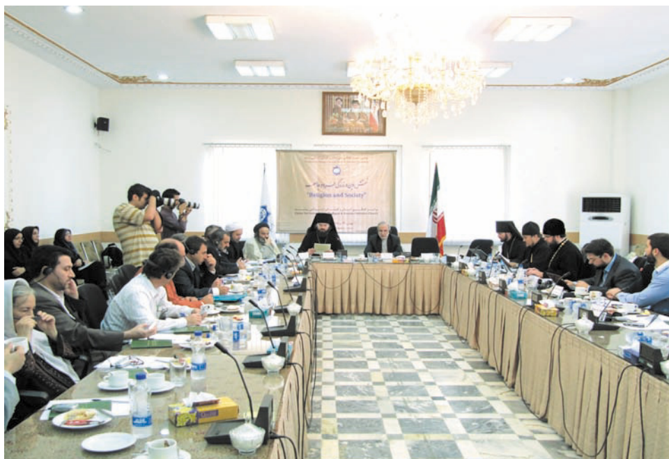
Начало заседания Комиссии «Ислам и Православие» (6 -7 октября 2010 г. В Тегеране)

посетил Исламскую Республику Иран. Визит был связан с переходом Свято-Николаевского Собора в Тегеране, находившегося с момента основания в 1945 году в ведении Русской Зарубежной Церкви, под юрисдикцию Московского Патриархата. В ходе визита владыка Кирилл, возглавлявший в то время Отдел внешних церковных сношений, встретился с аятолой Мухаммедом Али Тасхири, председателем Организации культуры и исламских связей ИРИ, а ныне главой Всемирной Ассамблеи по сближению исламских мазхабов. В феврале 1997 года аятолла Тасхири с ответным визитом побывал в Москве и был принят приснопамятным Патриархом Алексием II. В ходе состоявшихся переговоров было достигнуто соглашение о создании двухсторонней комиссии по диалогу между двумя религиозными общинами. Было решено проводить богословские встречи раз в два года, попеременно – то в Москве, то в Тегеране.