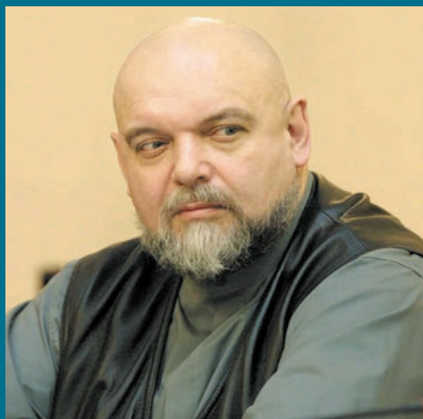
Гейдар ДЖЕМАЛЬ – Председатель исламского комитета России.

Уход Саудовской монархии мгновенно изменит расстановку сил и сведет к минимуму, если к нулю, "недоразумение" между шиитами и суннитами.