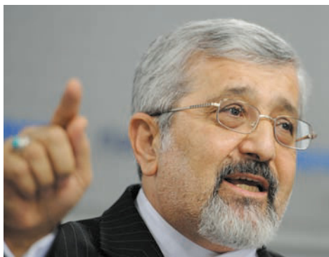
Пресс-конференция представителя Ирана при МАГАТЭ Али Асгара Солтание

зываются на экономике и финансах страны и положении и настроениях людей. Расчет простой – вызвать недовольство населения властями и устранить режим. Кроме того, западные СМИ и оппозиционные политтехнологи говорят иранцам: если правительство не хочет отказаться от ядерной программы, которая, мол, так обременяет иранцев и заставляет мировое сообщество применять против Ирана «калечащие санкции», надо убрать это правительство, и все блага современной цивилизации хлынут на страну мощным потоком. И еще один тезис, пропагандируемый извне – если иранская власть не остановит свою ядерную программу, США и Израиль могут прибегнуть к военной акции, и тогда будет гораздо хуже. За последние несколько лет о вот-вот грядущем военном нападении на Иран говорили серьезно несколько раз.